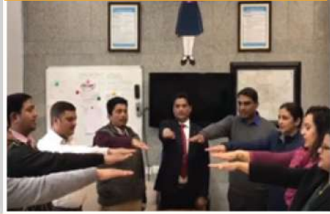
ଡିଏମଆରସି ବାରା ବୁଇଟ୍, ଜାତୀୟ ଭୋଟର ଦିବସ ପ୍ରତ୍ୟେକ ଜାନୁୟାରୀ ୨୫ରେ ପାଳନ କରାଯାଏ । ଏହି ବର୍ଷ ଥିଲା "ନଥିଲୁ ଲାଇକ୍ ଭୋଟିଂ", ଆଇ ଭୋଟ ଫର ସିୟୋର୍" । ଏହି ପରିପ୍ରେକ୍ଷାରେ, ଏହାର ସମସ୍ତ କାର୍ଯ୍ୟାଳୟରେ ଡିଏମଆରସିର କର୍ମଚାରୀମାନଙ୍କୁ ଏକ ପ୍ରତିଶ୍ରୁତି ଦିଆଯାଇଥିଲା । ଏକ ଭିନ୍ନ କରିବା ପାଇଁ ଆସନ୍ତୁ ସମସ୍ତେ ଭୋଟ୍ ଦେବା