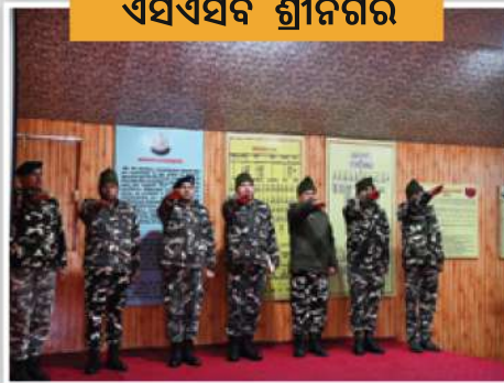
ଜାତୀୟ ଭୋଟର ଦିବସ ଅବସରରେ ୧୦ ବିଏନ୍.ଏସଏସବି ଶ୍ରୀନଗର (ଜାମୁ-କାଶ୍ମୀର)ର କର୍ମଚାରୀଙ୍କ ଦ୍ୱାରା ନିଆଯାଇଥିବା ଭୋଟର ପ୍ରତିଶ୍ରୁତି